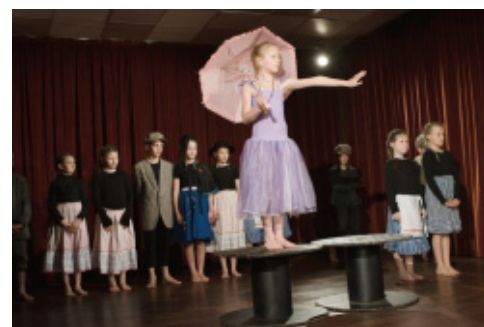
Soubor HraZeMě SZUŠ LiveArt!

Dílna bude pomocí improvizčních cvičení zaměřena na uvolnění spontánní kreativity, rozvinutí partnerského citění a situačního napojení, stejně jako osvojení si používání hereckých výrazových prostředků.