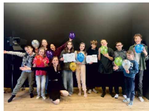
Soubor Prostě jini s úspěšnou inscenací Chceš víc?